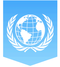
Tabla de contenidos